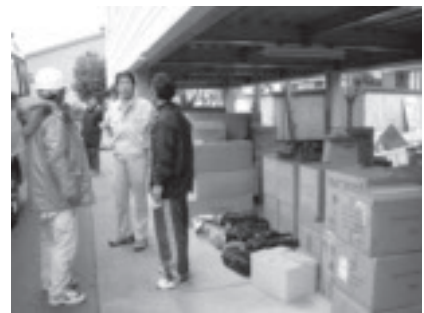
右:さくら市社協事務局長 中央:さくら市役所職員 左:高萩市役所職員