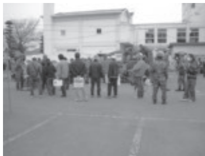
自衛隊による給水が行われ避難者の長い列