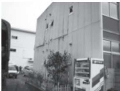
ひび割れた高萩市庁舎

両社からの提供物資の他、ラジオ16台、紙おむつ、粉ミルク、電池、栄養剤、キャンディなど市職員や社協職員等が持ち寄った支援物資をあわせて届けました。